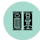
Alimentos no perecibles