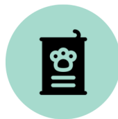
Suministro para mascotas