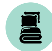
Mantas y almohadas