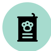
Suministro para mascotas