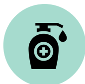
Desinfectante de manos