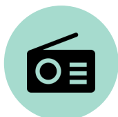
Radio a batería

Durante una situación de emergencia, es posible que no tenga tiempo de reunir suministros. Por eso es importante preparar un kit para catástrofes con antelación. Este kit debe contener todos los artículos más importantes que se detallan a continuación, y debe poder llevarse fácilmente en caso de evacuación. Planifique para al menos tres días. Es una buena idea guardar las provisiones que pueda tener por adelantado para no tener que prepararse en el último momento. Ten en cuenta que algunos artículos, como la medicación, quizá sólo puedan añadirse más tarde o deban actualizarse regularmente.