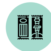
Alimentos no perecibles