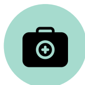
Botiquín de primeros auxilios