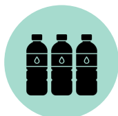
Suministro de agua potable