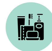
Artículos de higiene