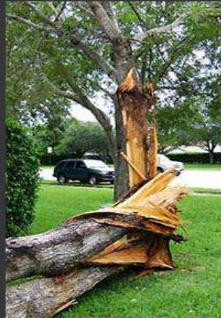
Mitad de la copa perdida, varios tallos quebrados.

¿Cuánto daño puede soportar un árbol? ¿Qué partes del árbol fueron afectadas? ¿Cuánto de la copa se ha perdido? ¿Qué tan grandes son las heridas? Entre más grande sea la herida en relación con el tamaño del tallo, menos probabilidad tiene de curarse (de cicatrizar) siendo el árbol vulnerable a la pudrición, las enfermedades y las plagas. Los árboles con mayor daño requerirán más trabajo que los que tengan un daño menor. Por ejemplo, si el árbol solo está defoliado con unas pocas ramas quebradas, remover las ramas quebradas es la única acción que se necesita tomar (fotografía izquierda). Al árbol se le debe permitir rebrotar. Sin embargo, si cerca de más de la mitad de la copa esta dañada (incluyendo el líder principal) con varias ramas grandes quebradas, el árbol debe ser tumbado (fotografía derecha). Se debe llamar un arboricultor certificado para analizar toda situación dudosa y para efectuar las podas y la remoción de ramas necesarias.