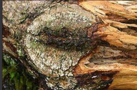
Rama quebrada en un corte de poda grande hecho hace años.

Prácticas pobres de poda hacen árboles susceptibles a fallas/daños.