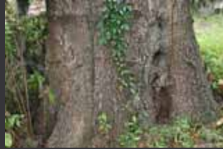
Pudrición interna invisible.