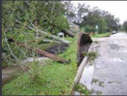
Espacio insuficiente para enraizar.

Los árboles necesitan un espacio adecuado y buenas propiedades del suelo.