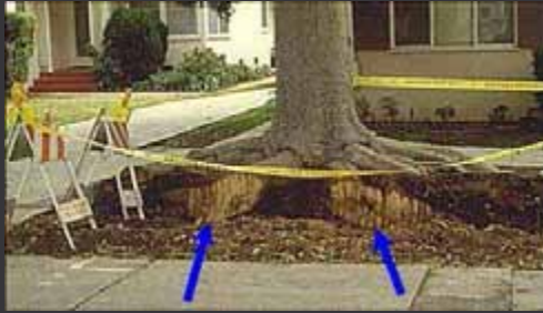
Raíces cortadas durante la reparación de aceras.

Prácticas de manejo pobres y problemas en la raíz afectarán la estabilidad del árbol.