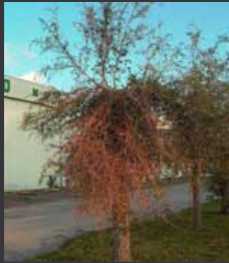
Árbol desmochado hace un año.

Prácticas pobres de poda hacen árboles susceptibles a fallas/daños.