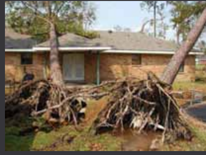
Suelos encharcados limitan la profundización de las raíces.

Árboles con su sistema radicular confinado a espacios con poco suelo no son tan estables como los árboles a los que se les permite desarrollar su sistema radicular más ampliamente. Las raíces en éstos árboles (izquierda) fueron limitadas por el borde de la acera haciéndolas muy susceptibles a caerse en la dirección contraria al borde. Las raíces que crecen en la dirección de los vientos son altamente responsables de la estabilidad del árbol.