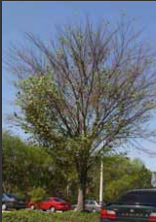
Defoliado, pocas ramas quebradas.

Árboles muy dañados necesitan ser removidos.